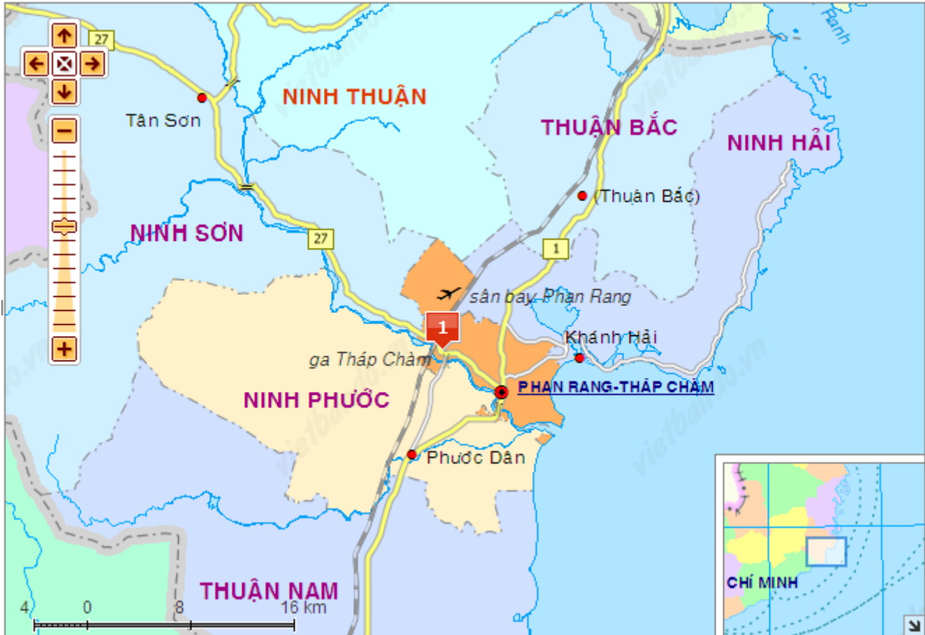
Hình: Vị trí tỉnh Ninh Thuận

Ninh Thuận là một tỉnh ven biển thuộc vùng Nam Trung Bộ của Việt Nam được cả nước biết đến là một vùng có khí hậu khắc nghiệt và khô hạn vào bậc nhất cả nước. Bên cạnh đó, dưới áp lực của gia tăng dân số, nhu cầu phát triển kinh tế xã hội đã ảnh hưởng tiêu cực đến tài nguyên nước như cạn kiệt nguồn nước mùa cạn, hạ thấp mực nước ngầm, suy thoái chất lượng nước. Vì vậy, cần nâng cao nhận thức cộng đồng trong quản lý, bảo vệ, khai thác và sử dụng tài nguyên nước có hiệu quả tại Ninh Thuận.